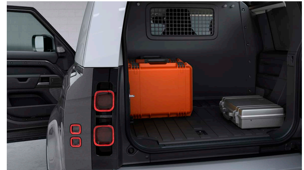
DEFENDER 90 HARD TOP