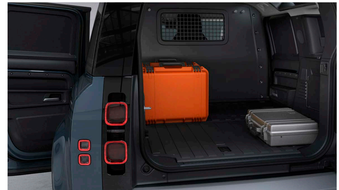
DEFENDER 110 HARD TOP